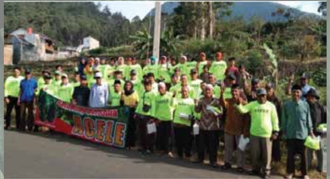
Temu Tani Puntang - Oktober 2019