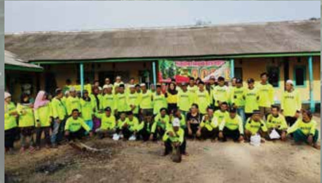
Temu Tani Sukabumi - April 2019