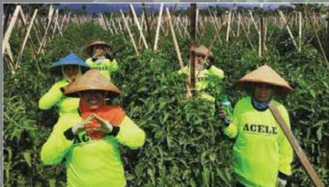
Temu Tani Pangalengan - oktober 2019