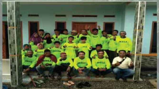
Temu Tani Cisarua - Desember 2019