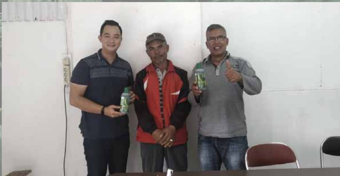
Kunjungan ke Indo Evergreen Pertanian Jamur Oktober - 2019