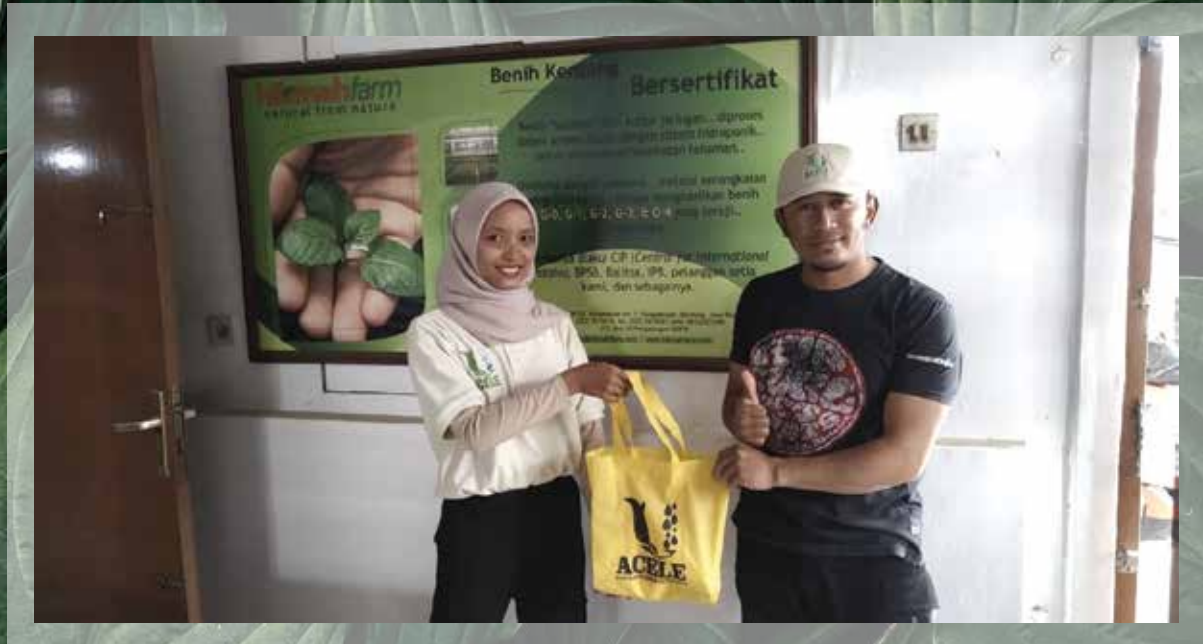
Kerja sama dengan PD Hikmah Farm untuk Bibit Kentang Oktober - 2019