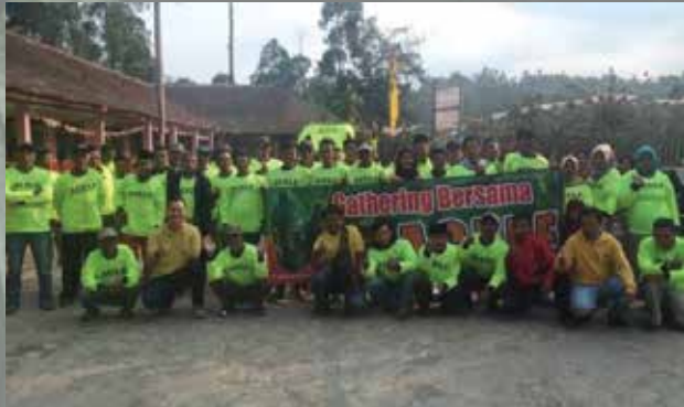
Temu Tani Garut - Oktober 2019