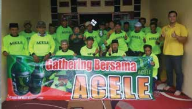
Temu Tani Ciwidey - April 2019