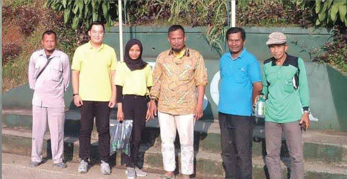
Kunjungan ke OISCA Sukabumi September - 2019