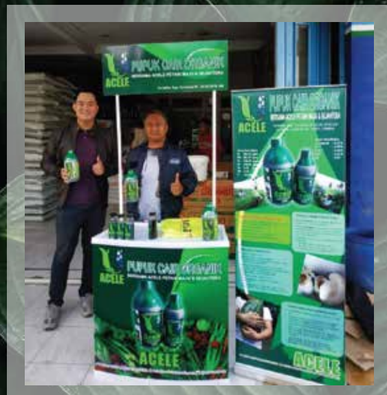
Open Stand Rancabali Agustus - 2019