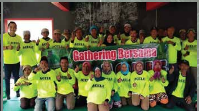
Temu Tani Ciwidey - Juli 2019