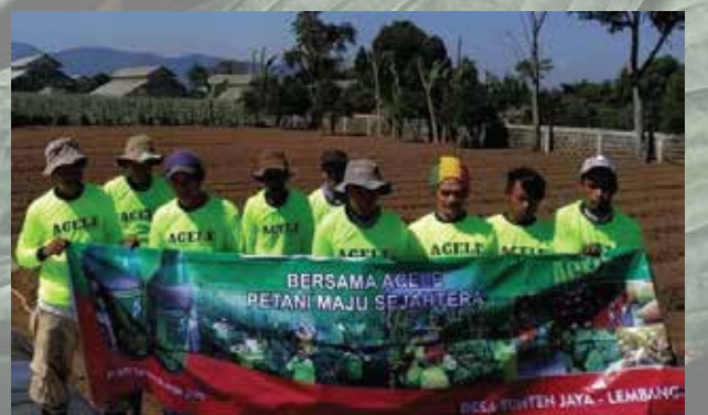
Komunitas ACELE Cikole