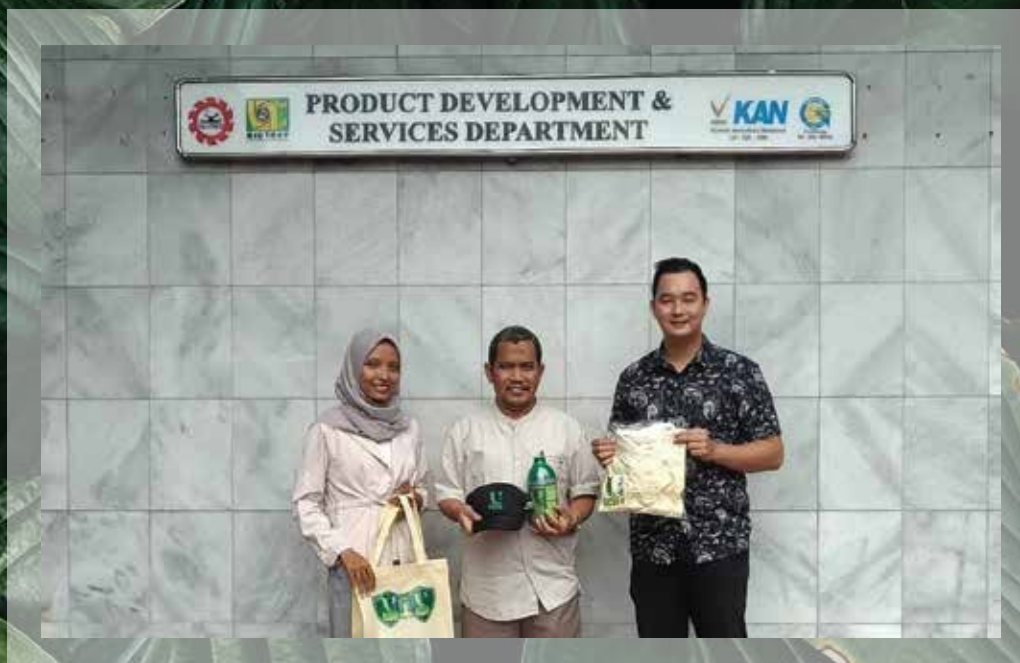
Kunjungan ke SEAMEO BIOTROP Bogor Agustus - 2019