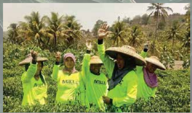
Temu Tani Cianjur - Oktober 2019