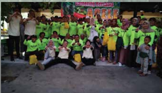
Temu Tani Lembang - April 2019