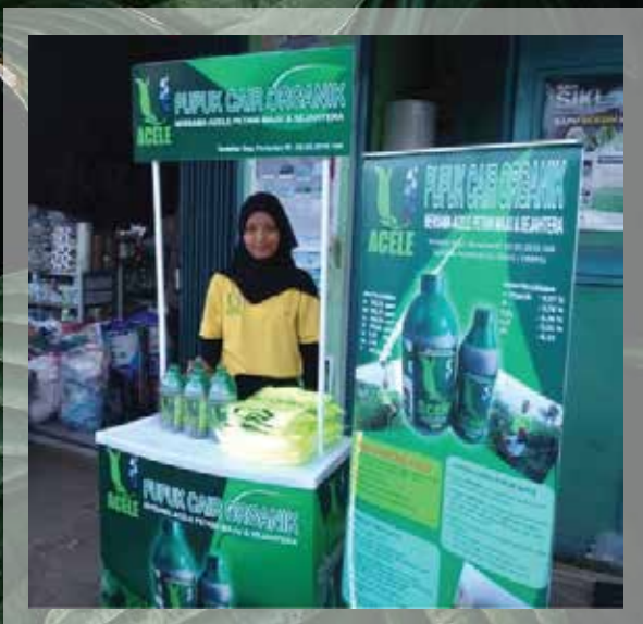
Open Stand Maribaya Agustus - 2019