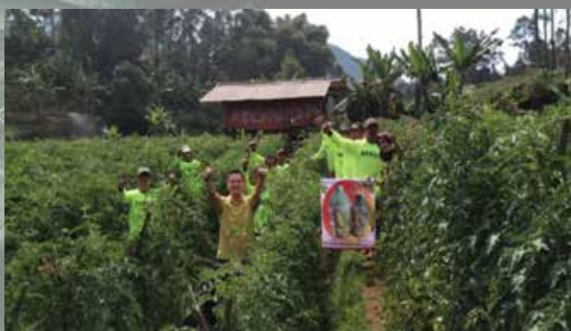
Temu Tani Pangalengan - Agustus 2019