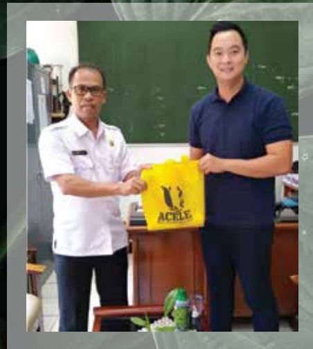
Kunjungan ke SMK Pertanian Lembang Agustus - 2019