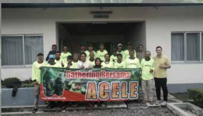
Temu Tani Dinas Kentang Pangalengan