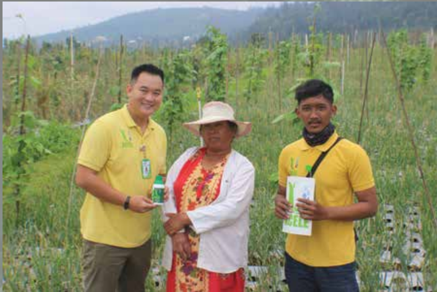
Kunjungan ke Petani Bawang Merah - 2020